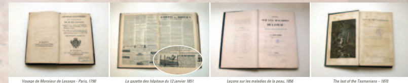
Voyage de Monsieur de Lassepe - Paris, 1790 La gazette des hôpitaux du 12 janvier 1851 Leçons sur les maladies de la peau, 1856 The last of the Tasmanians - 1870