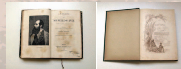
La Nouvelle Guinée - 1883 Les habitants de Suriname, 1884