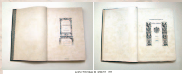
Galerias historiques de Versailles - 1838