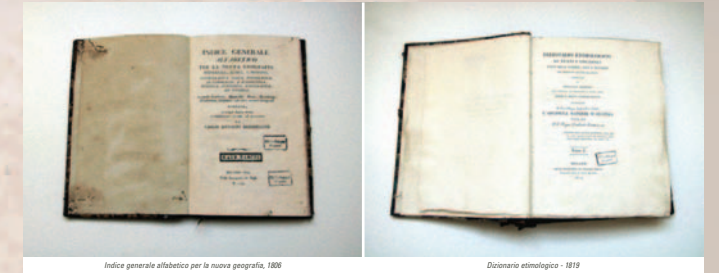
Indice generale alfabetico per la nuova geografia, 1806