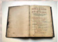
Portraits des Rois de France, 1636