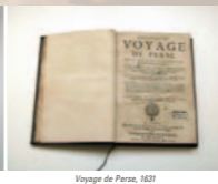
Voyage de Perse, 1631