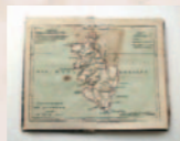
Département du Liamone

La Bibliothèque d'Ajaccio est l'œuvre de Lucien Bonaparte, second des frères de Napoléon.