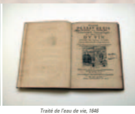
Traité de l'eau de vie, 1646