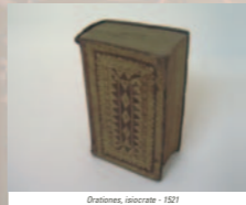
Orationes, inchoate - 1521

Oratorii Parisiensis catalogo inscriptus Ex libris Congreg onis Mellifloris sumis S an cti Lazari Parisiensis