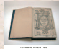
Architecture, Philibert - 1568