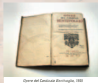
Opere del Cardinale Bentivoglio, 1645