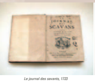
Le journal des sçavans, 1723