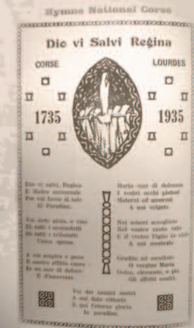
Paru dans L'Arimitu di a Macchia