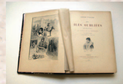
Les îles oubliées 1893