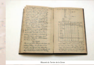
Résumé du Terrier de la Corse