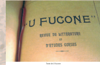
Texte de U fucone

«Parler du «Fucone» ? Comment faire comprendre à des étrangers ce que représente d'auguste, de sévère et de doux ce mot qui résume la vie morale, la vie sociale, la psychologie de la Corse ?» Autour du «Fucone» Paul Fontana