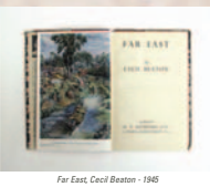
Far East, Cecil Beaton - 1945