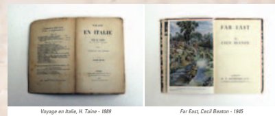
Voyage en Italie, H. Taine - 1889