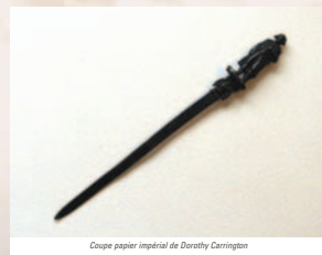
Coupe papier impérial de Dorothy Carrington