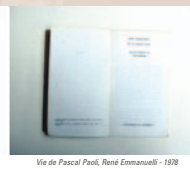
Via de Pascal Paoli, René Emmanuel - 1978