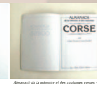
Almanach de la mémoire et des coutumes corse - 1980