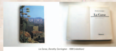
La Corse, Dorothy Carrington - 1939 (réédition)